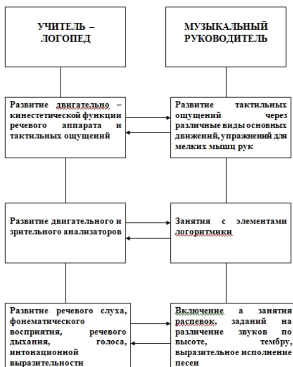
МОДЕЛЬ ВЗАИМОДЕЙСТВИЯ УЧИТЕЛЯ-ЛОГОПЕДА С МУЗЫКАЛЬНЫМ РУКОВОДИТЕЛЕМ